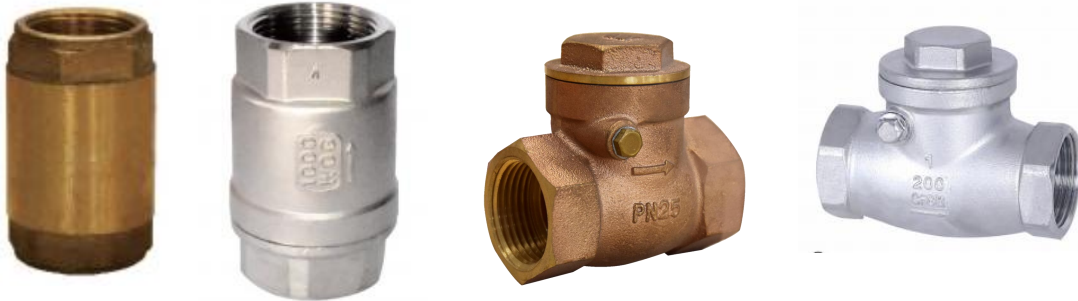
立式、旋启止回阀 A8004/A8005/A8006/A8007/A8008...系列 螺纹连接 PN16、PN25