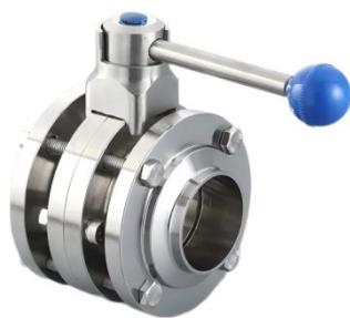
不锈钢三片式蝶阀 PN10

不锈钢三片式蝶阀具有较强的耐酸碱和耐高温性能，永久压缩变形小，精密锻造阀芯：快装产品耐压 \leq 1.0\text{MPa} ，无弯曲；金相结构优于精密铸件；具有扭矩小，寿命长等特点，正常开关 10 万次以上；